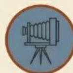
Φωτογραφικά & Κινηματογραφικά είδη