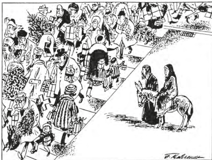
Σκίτσο χωρίς λόγια. Του F. Behrendt (Μπέρεντ), Γερμανία, 1970

Με δυο λόγια: Όλη η πραγματικότητα είναι παρούσα στην εικόνα: φύση και υπερφυσικά, ορατά και αόρατα, γήινα και ουράνια, θεία και ανθρώπινα. Όλα: γεγονότα, πρόσωπα και χρώματα, σχήματα και μορφές της εικόνας συμβολίζουν και εκφράζουν σημαντικές αλήθειες για το γεγονός και για τη ζωή.