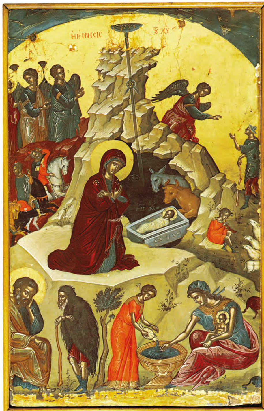
Η Γέννηση του Χριστού. Φορητή εικόνα, Θεοφάνους του Κρητός, Ιερά Μονή Σταυρονικήτα, Άγ. Όρος, 1546

1. Ο στάβλος. Είναι σκοτεινός μέσα σε βράχο. Η σκοτεινιά συμβολίζει την άγνοια, την πλάνη και την μη αληθινή ζωή των ανθρώπων πριν τον ερχομό του Χριστού. Αυτός θα ρίξει και σε αυτούς το λυτρωτικό φως της αλήθειας του. Διαβάζουμε στον Μτ 4, 16: