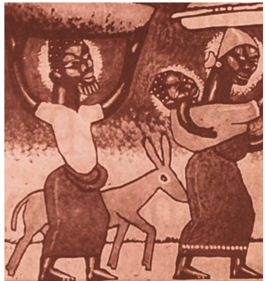
Η φυγή στην Αίγυπτο. Έργο ανώνυμου λαϊκού ζωγράφου της Αφρικής