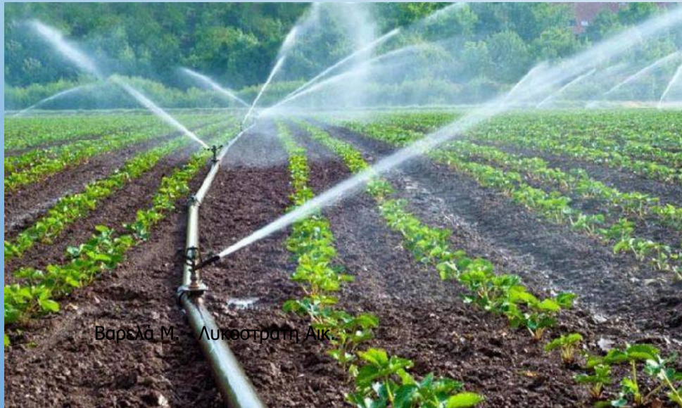
Βαρσά Μ. - Λυκοστράτη Αικ.