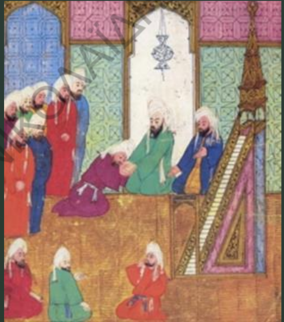
περσική μινιατούρα με τον χαλίφη Αμπού Μπακρ