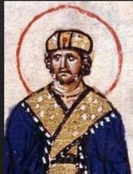
Θεοδώρα και Μιχαήλ Γ'