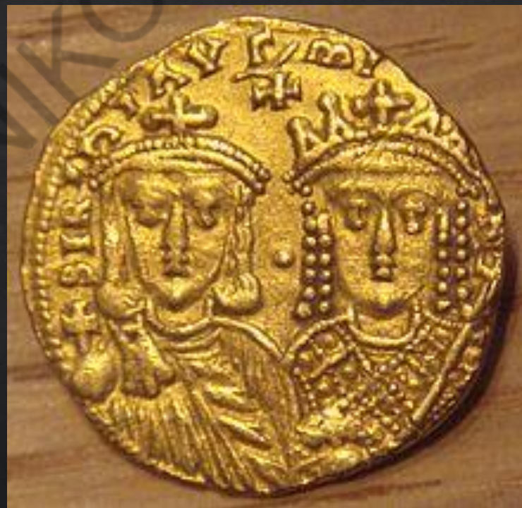
Ο Κωνσταντίνος ΣΤ' και η μητέρα του Ειρήνη η Αθηναία