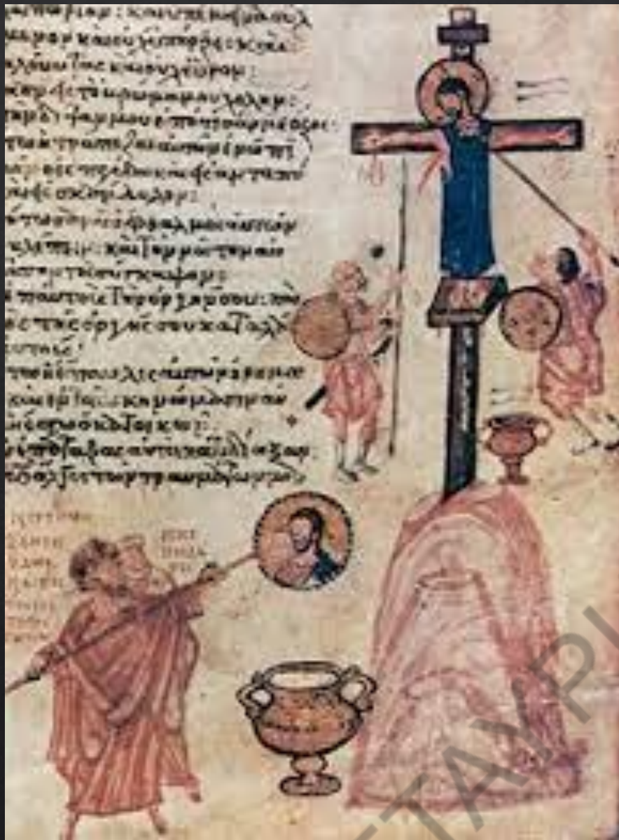
Επικάλυψη με ασβέστη της εικόνας του Χριστού (μικρογραφία χειρογράφου)