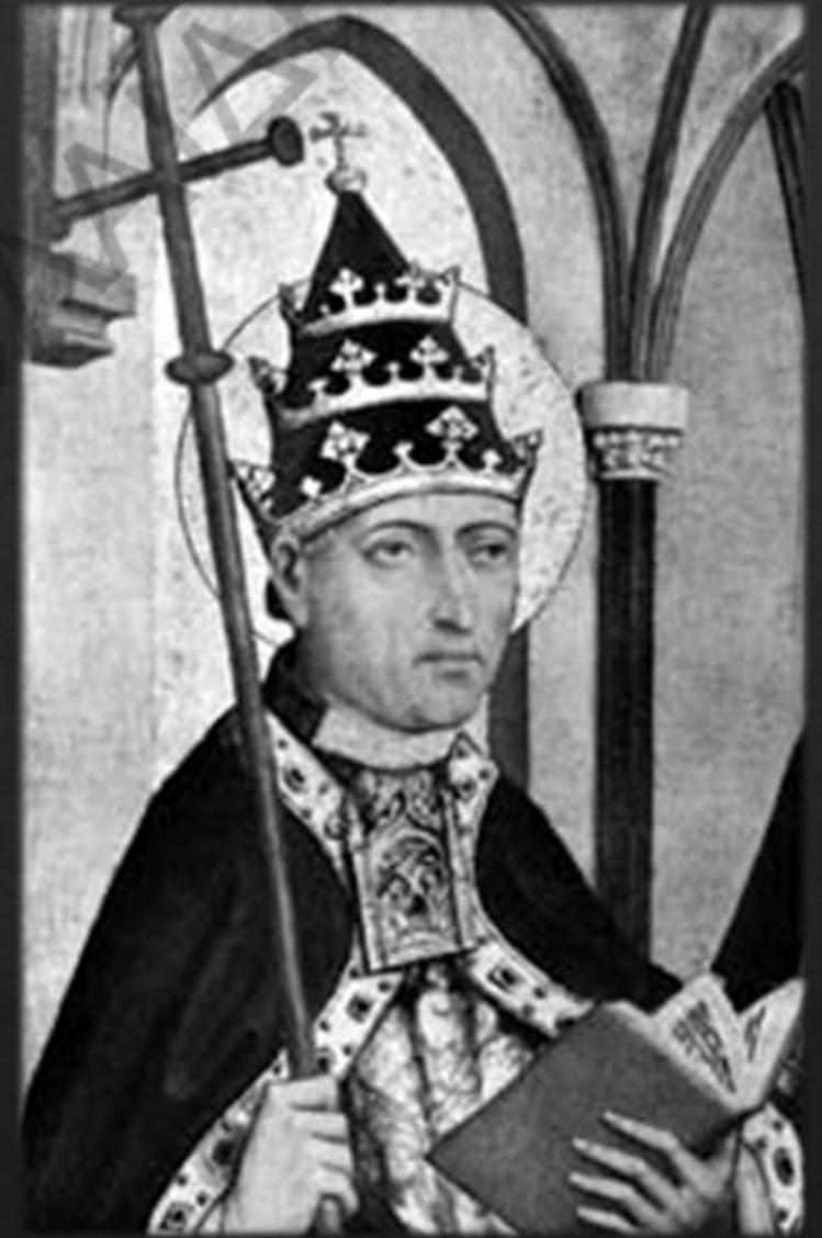
Πάπας Γρηγόριος Β' (715-731)