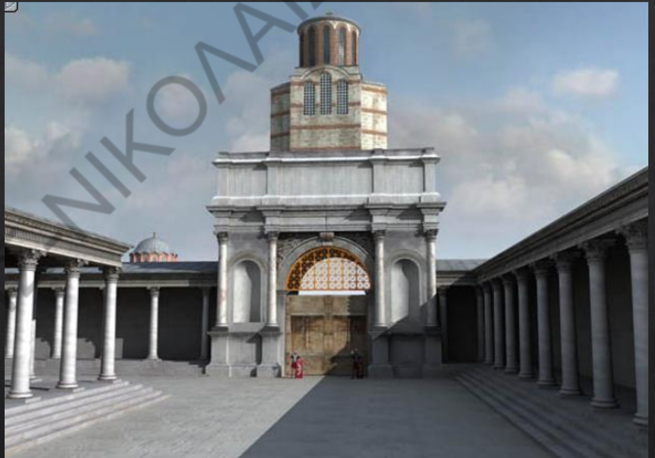
Η χαλκή πύλη του Ιερού Παλατίου