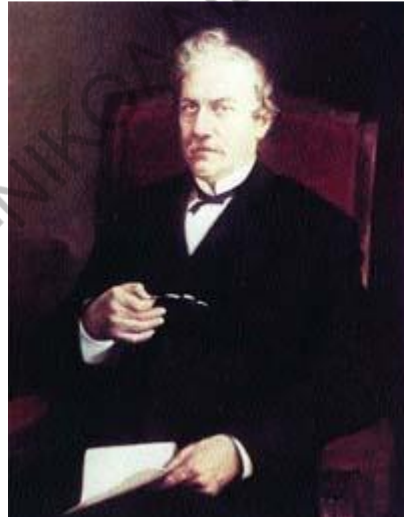
Κ. Παπαρρηγόπουλος (1815 – 1891)