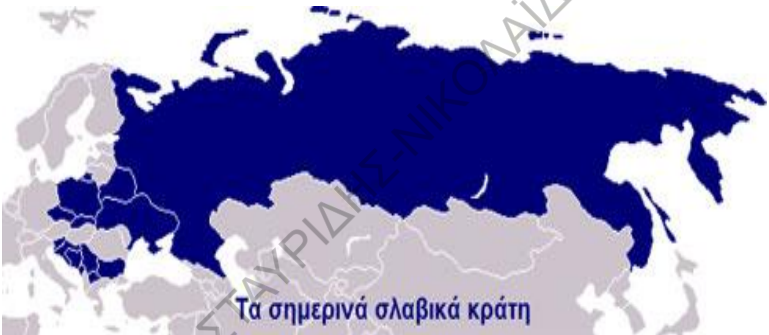
Τα σημερινά σλαβικά κράτη