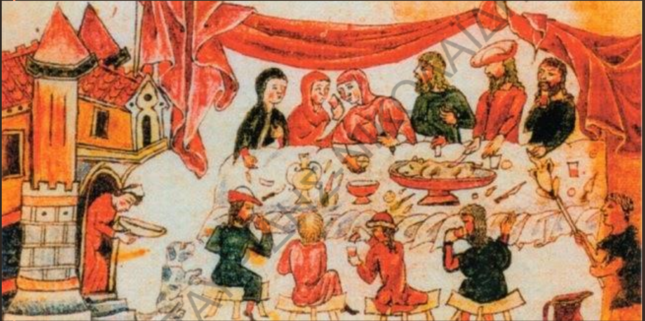
Δείπνο πλουσίων. Μικρογραφία χειρογράφου του 14ου αιώνα