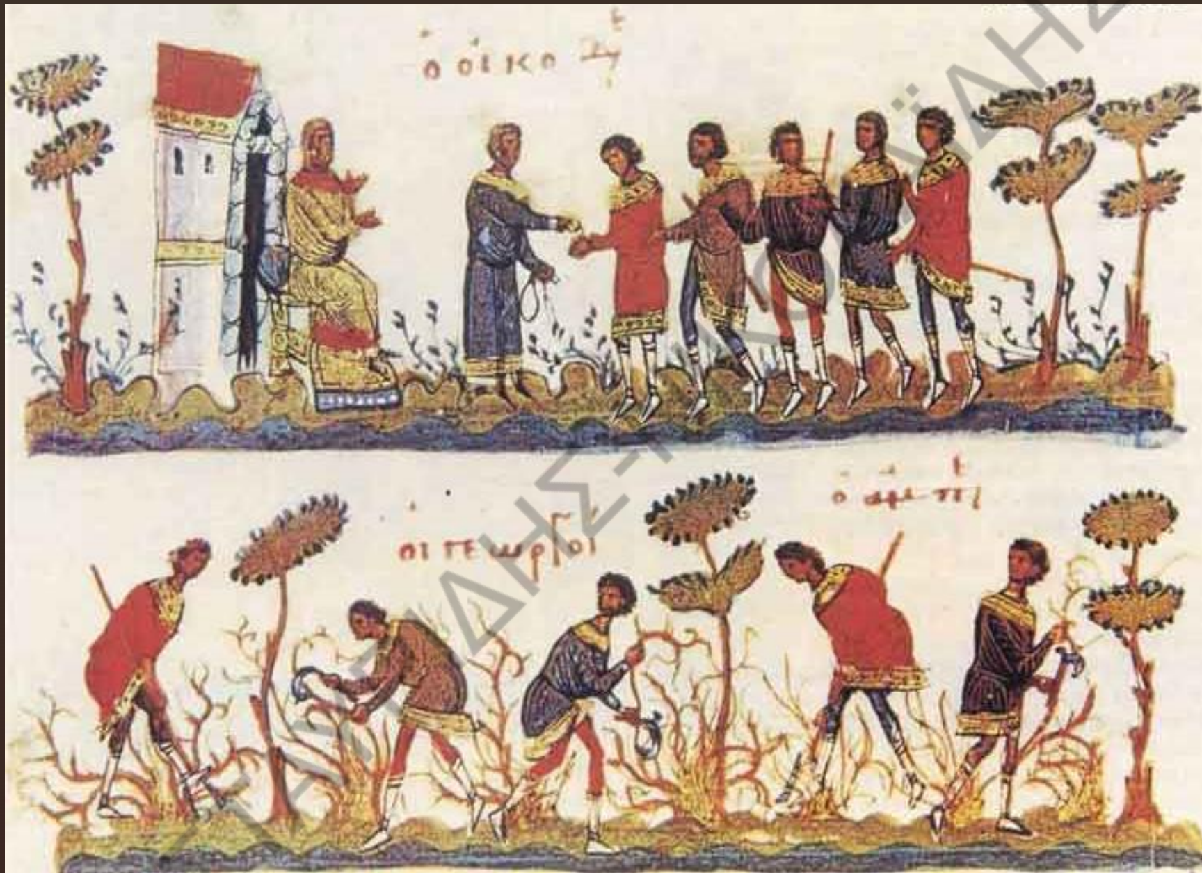
Σκηνή από την αγροτική ζωή (μικρογραφία σε Ευαγγέλιο)