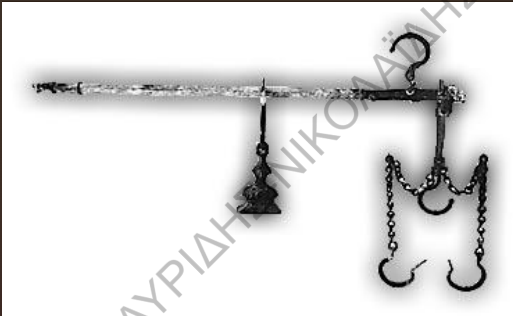
χάλκινη ζυγαριά από ναυάγιο εμπορικού πλοίου του 7ου αιώνα. Turkey, Bodrum Museum of Underwater Archaeology