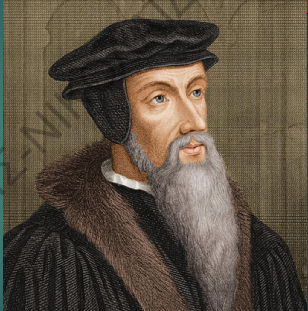
ΙΩΑΝΝΗΣ ΚΑΛΒΙΝΟΣ (1509-1564)