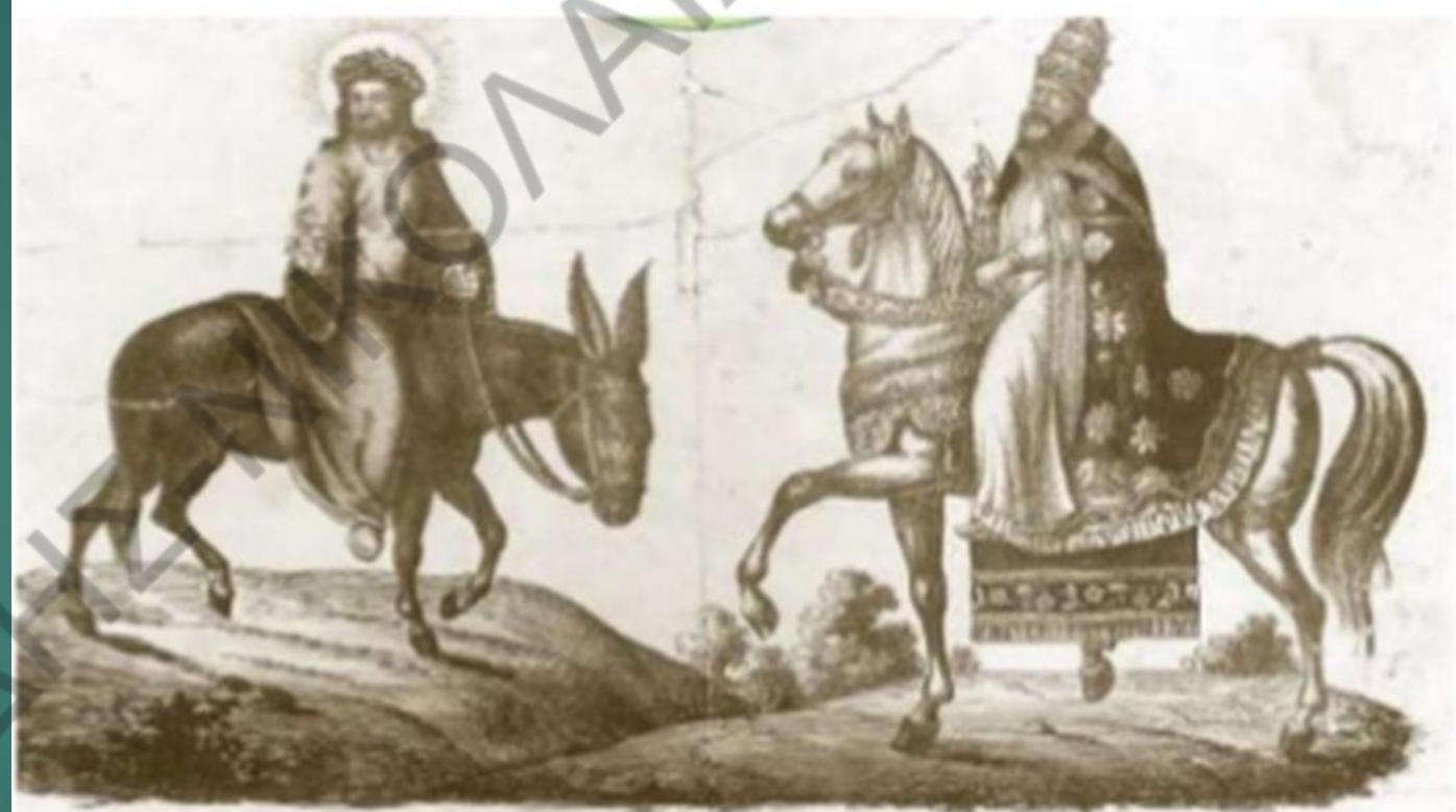
▲ Ευλογηφία με το Χριστό και τον πάπα. Ο Χριστός με φτωχικά ρούχα, πάνω σε γαϊδουράκι, ενώ ο πάπας με πλούσια ρούχα, πάνω σε άλογο. Γύρω στο 1540, Νυρεμβέργη (Γερμανία), Εθνικό Γερμανικό Μουσείο.