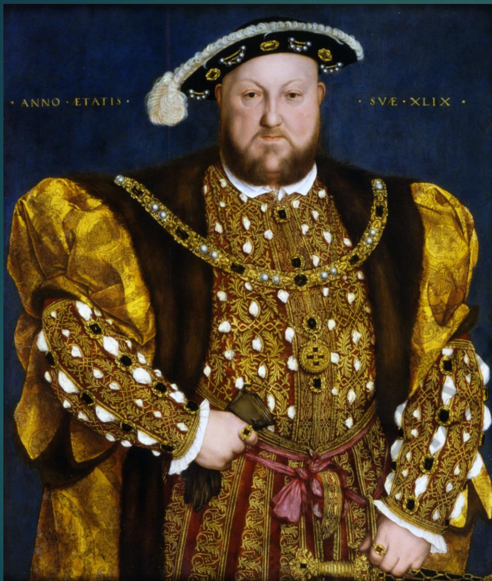
ΕΡΡΙΚΟΣ Η' ΤΥΔΩΡ