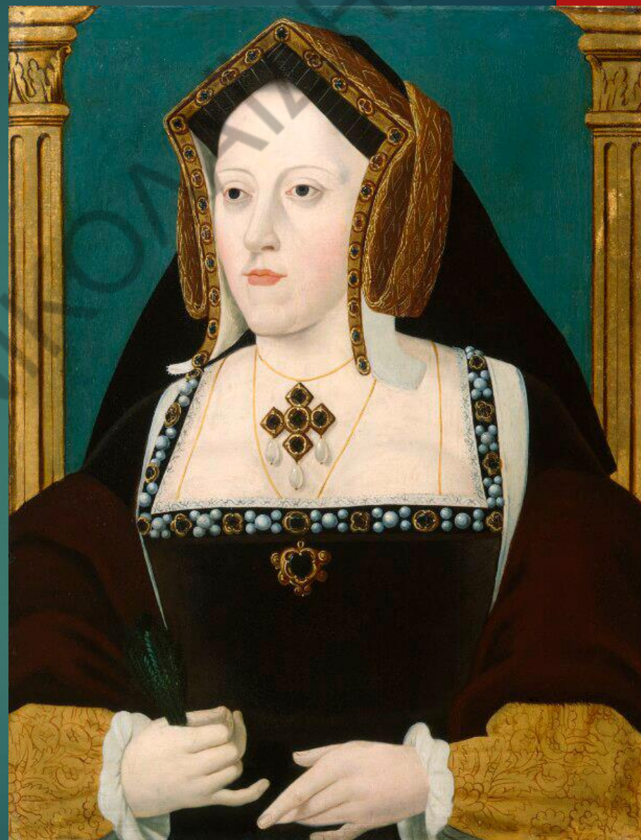
ΑΙΚΑΤΕΡΙΝΗ ΤΗΣ ΑΡΑΓΩΝΙΑΣ