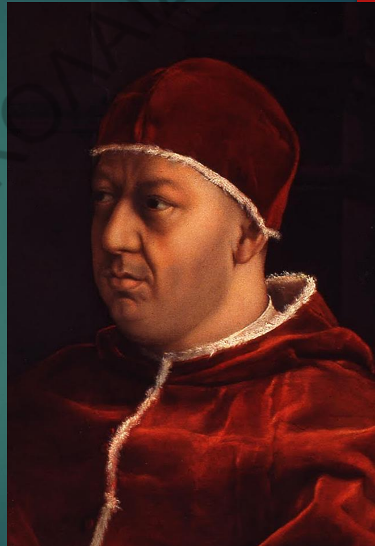
Πάπας ΛΕΩΝ Ι΄