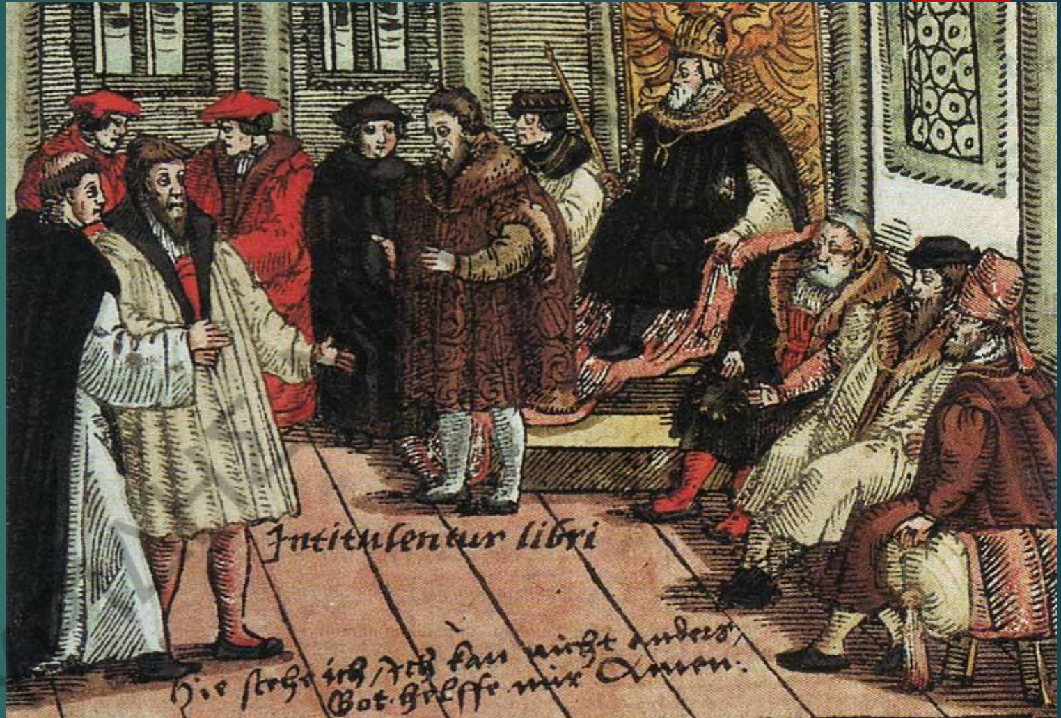
Ο Λούθηρος στη Δίαιτα (Ράιχσταγκ) της Βορμς (έγχρωμη ξυλογραφία, 1557)