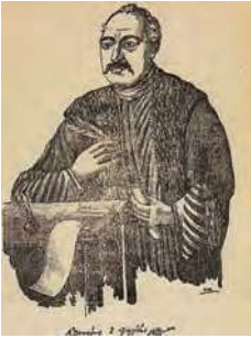
◀ Αθανάσιος Ψαλίδας 1767-1829 Ιωάννινα