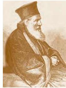
◀ Θεόκλητος Φαρμακίδης 1784-1860 Νίκαια Λάρισας