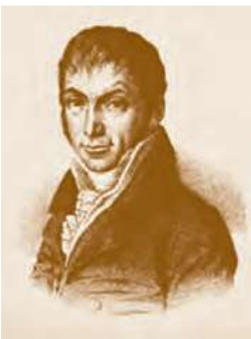
◀ Κωνσταντίνος Κούμας 1777-1836 Λάρισα