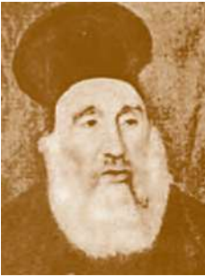
◀ Νεόφυτος Βάμβας 1770-1855 Χίος