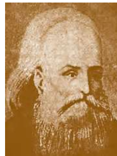
◀ Θεόφιλος Καΐρης 1784-1853 Άνδρος