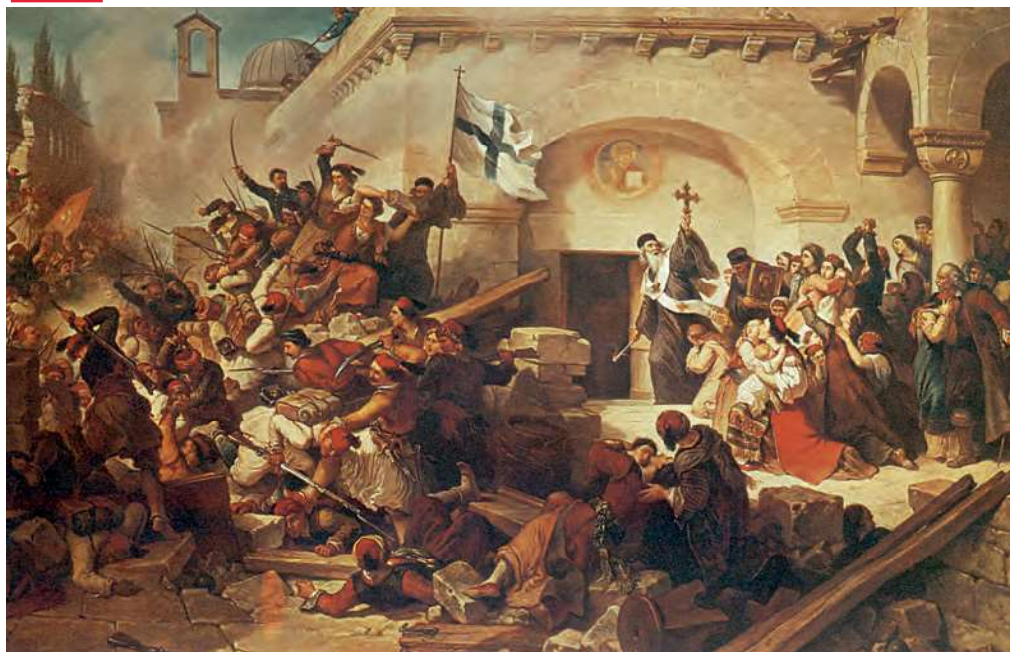
1. Το ολοκαύτωμα της μονής Αρκαδίου. Πίνακας του Ιταλού ζωγράφου Γκατέρι. Το φιλελληνικό ρεύμα ήταν ιδιαίτερα ισχυρό εκείνη την εποχή στην Ιταλία και δεκάδες Ιταλοί εθελοντές συμμετείχαν στην κρητική επανάσταση του 1866.

Οι προσπάθειες των Ελλήνων της Κρήτης, των ελεύθερων Ελλήνων και του ελληνικού κράτους για ένωση της Κρήτης με την Ελλάδα, καθώς και η εμπλοκή της Οθωμανικής αυτοκρατορίας και των Δυνάμεων σ' αυτές ονομάστηκαν κρητικό ζήτημα .