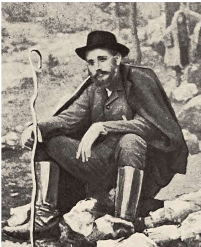
3. Ο Ελευθέριος Βενιζέλος στο Θέρισο κατά την επανάσταση του 1905.