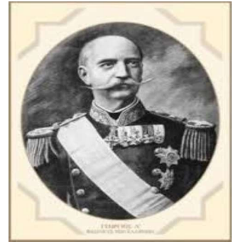
Ο Γεώργιος Α' βασιλιάς των Ελλήνων

1864: Τα Επτάνησα ενσωματώνονται στο ελληνικό κράτος